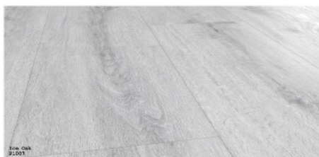
Ice Oak P1007