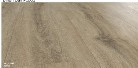
Vall Oak P1003