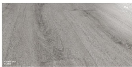
Ansen Oak P1002