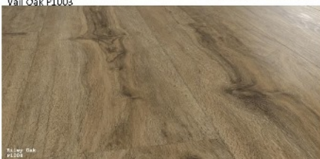
Riley Oak P1004