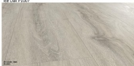
Dillon Oak P1001